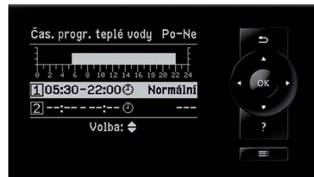
Nová regulace Vitotronic - snadná obsluha díky jednoduché navigaci a velkému jasně čitelnému displeji, např. k nastavení spínacích časů.

Vitoladens 300-W je kompaktní olejový kondenzační kotel k montáži na stěnu. Zabudovaný tlumič hluku umožňuje tichý provoz i v bytě, např. v úklidové komoře. Výměník tepla z ušlechtilé oceli odolný proti korozi, který pochází z vlastní výroby, je optimálně přizpůsoben vlastnostem kompaktního modrého hořáku.